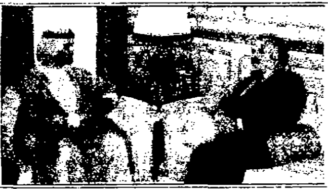
● تصوير: جورج كززيان